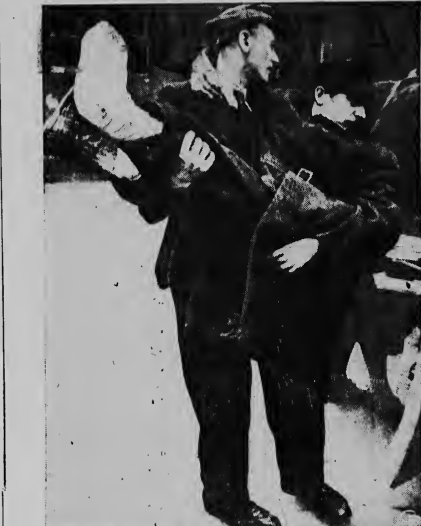
Een Duitse oorlogsgevangene, die 10 jaren in Rusland werd vast- gehouden, wordt naar een ambulance gedragen te Lichtenfels, Duits- land, waar hij aankam uit een kamp in Potma, dicht bij Moskou. Zijn voeten waren bevroren en zijn fysieke toestand was geheel ver- zwakt.

NIEUW BREIEN ZONDER NAALDEN! HFL. 12.— Sneller, veel gemakkelijker, mooier en gelijkmatiger! Met het nieuwe brel-apparaat Rota- Pin kunt U zonder enige kennis van breien het mooiste brelwerk maken. Pull overs, babykledjes, sokken, handschoenen, enz. Rond- breien, meederen, minderen, enz. Brelbreedte tot 160 steken. Bestel Uw Rota-Pin vandaag nog. Geheel compleet met geïllustreerde handleiding voor modellen en ste- ken SLECHTS 12.— Hfl. franco per zeepost. Toezending kan ge- schieden na ontvangst van Inter- nationale postwissel of cheque of onder rembours. ROTA-PIN N.V. LISA, Afd. 1 Ymuiden, Nederland